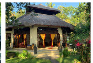
Yoga Raum am Strand