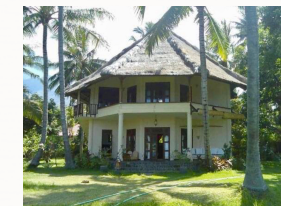
Bungalow am Strand