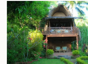
Bungalow am Berg

Es gibt einen Shuttle Service zum Strand.