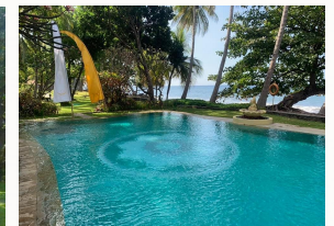
Pool am Strand