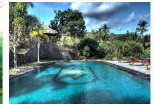
Pool am Berg