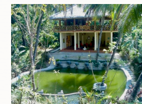
Yoga Raum am Berg

Die Preise beinhalten Unterkunft, Verpflegung und 2 Kurse/Tag. Nicht inbegriffen ist der Flug (ab 800 €), Visa, Taxi vom Flughafen, Trinkgeld & Ausflüge: Wasserfälle/Quellen, Schnorcheln/Tauchen, Delphin Tour, Tempel Besuche, Reisfelder, Bergwanderung auf den Batur (Vulkan mit See), Elefanten waschen... Beratungsgespräch vor und nach der Reise inklusive.